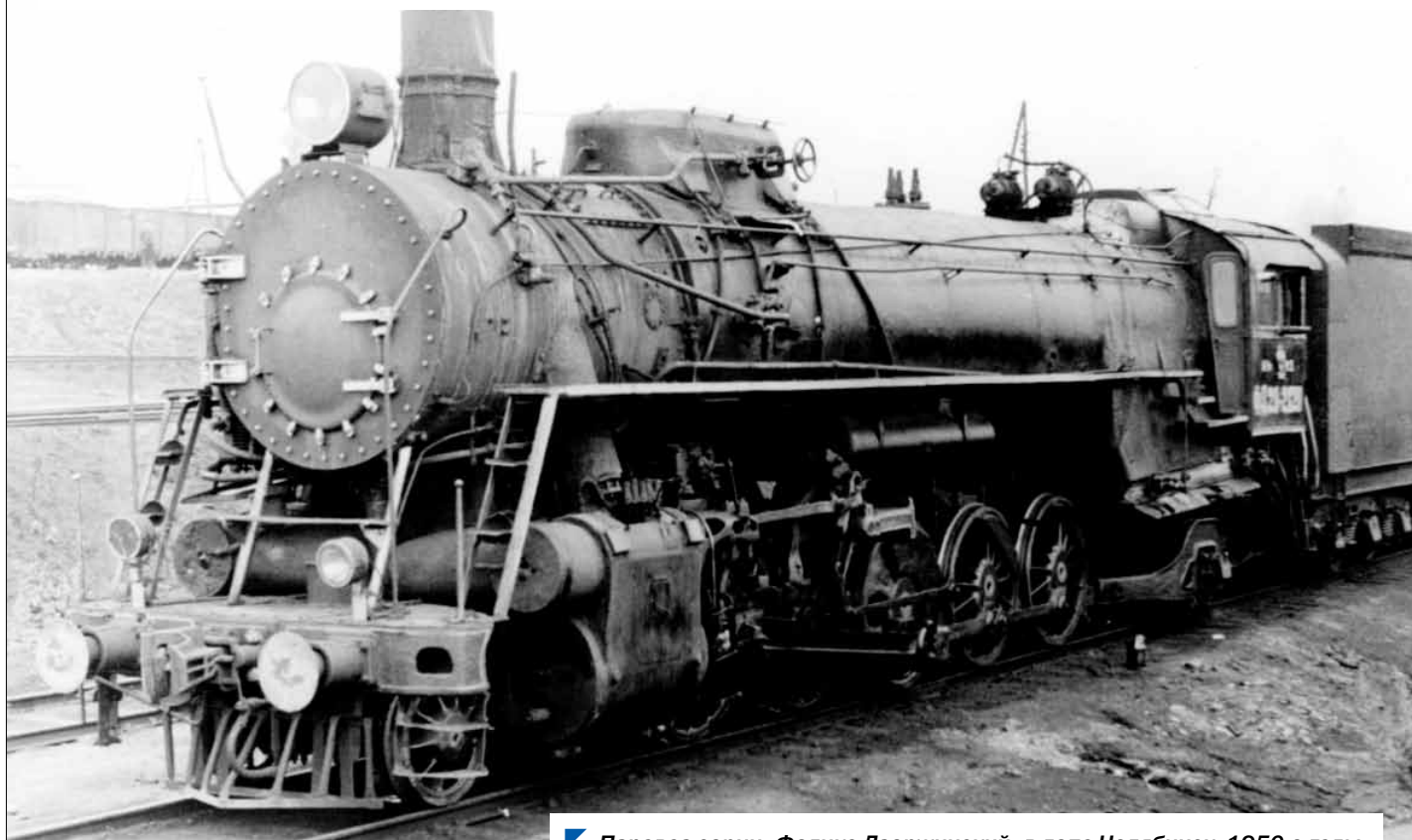
▶ Паровоз серии «Феликс Дзержинский» в депо Челябинск, 1950-е годы.