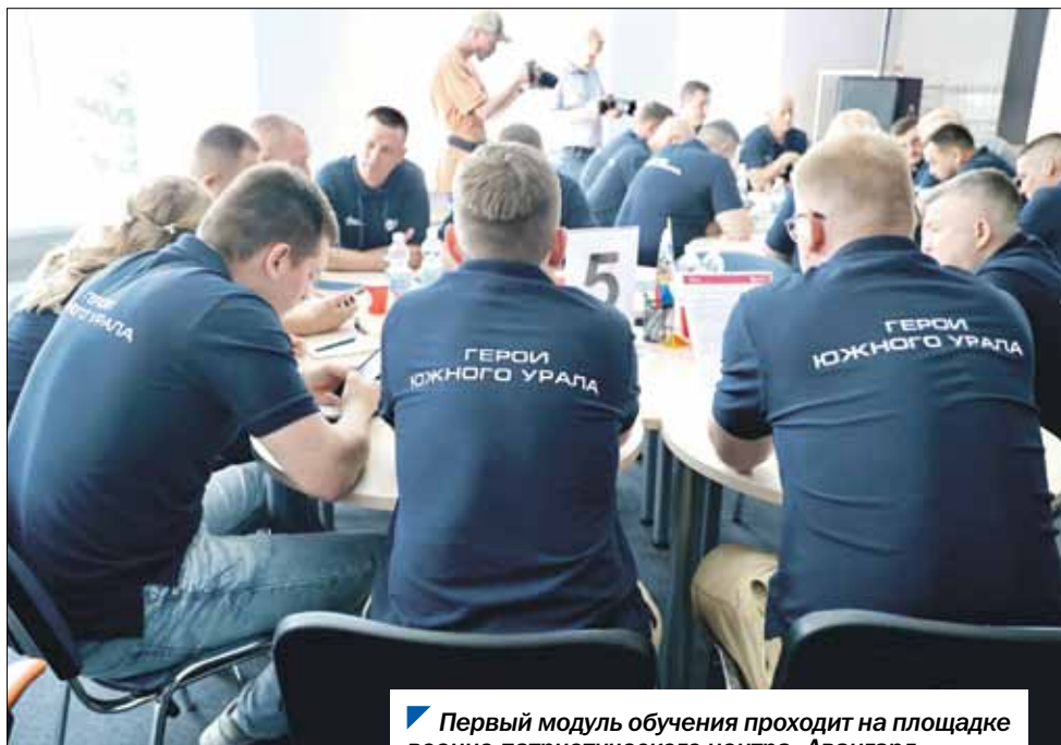
Первый модуль обучения проходит на площадке военно-патриотического центра «Авангард».

Участники образовательной программы интересовались вопросами муниципальной реформы, изменениями, связанными со сменой районов на округа, новым способом избрания главы областного центра — Челябинска. Задавали вопросы и об ограничениях и требованиях, которые предъявляются к госслужащим и депутатам.