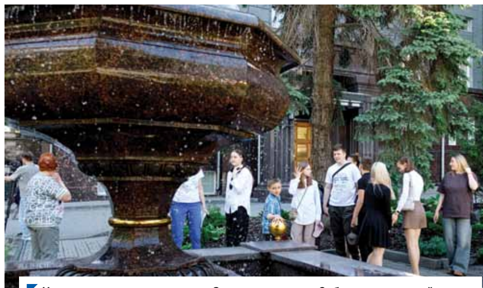
Немногие знают, что во дворе Законодательного Собрания есть такой сквер.