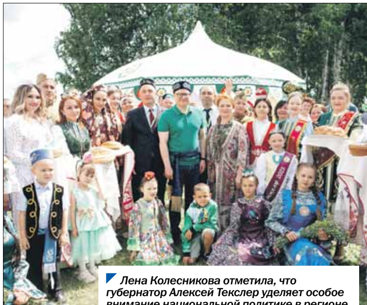
Лена Колесникова отметила, что губернатор Алексей Текслер уделяет особое внимание национальной политике в регионе.

Национально-культурный праздник в деревне Норкино посетили губернатор Алексей Текслер, верховный муфтий России Талгат Таджуддин и депутат Законодательного Собрания Лена Колесникова.