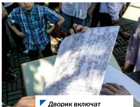
Дворик включают в экскурсионный маршрут.

Отметим, подобный сквер законодателей есть и у парламентариев Санкт-Петербурга. Он находится на территории Мариинского дворца.