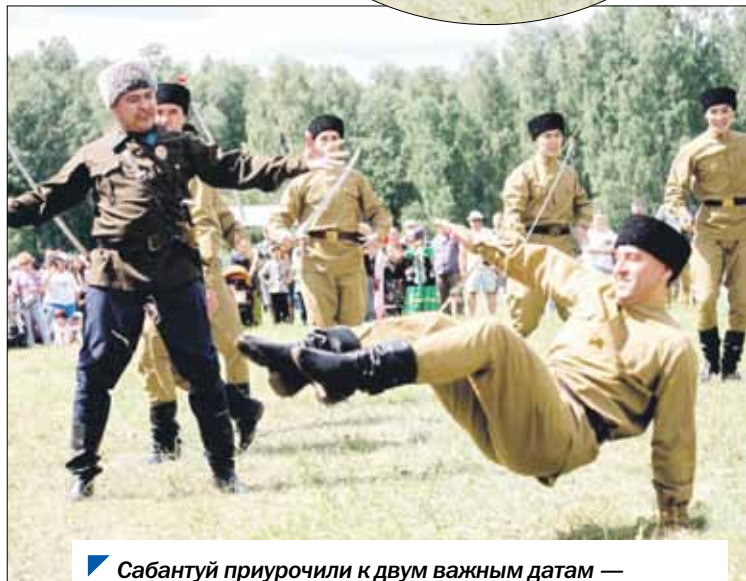
Сабантуй приурочили к двум важным датам — Году защитника Отечества и 80-летию Великой Победы.