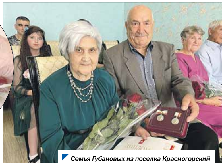
Семья Губановых из поселка Красногорский Еманжелинского муниципального округа.

Обладателями региональной награды стали также еще