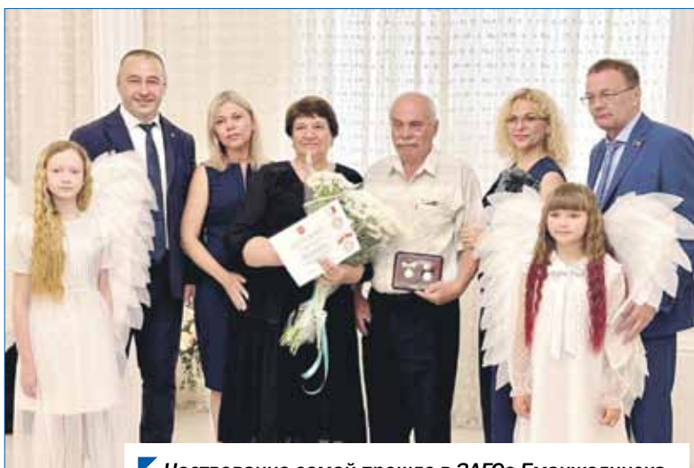
Чествование семей прошло в ЗАГСе Еманжелинска.